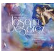
Vol.6 Josquin et Condé sur l'Escaut