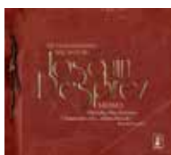
Vol.5 Josquin et Ferrare