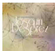
Vol.3 Josquin et Rome 1