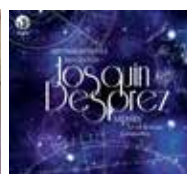
Vol.4 Josquin et Rome 2