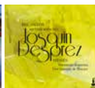
Vol.7 Josquin et l'Espagne