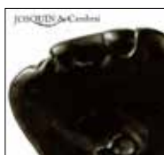
Vol.2 Josquin et Cambrai