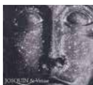
Vol.1 Josquin et Venise