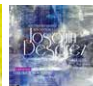
Vol.8 Josquin et Milan